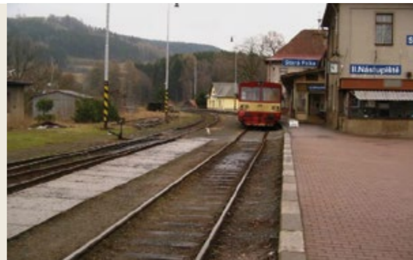
Fotografie před a po rekonstrukci